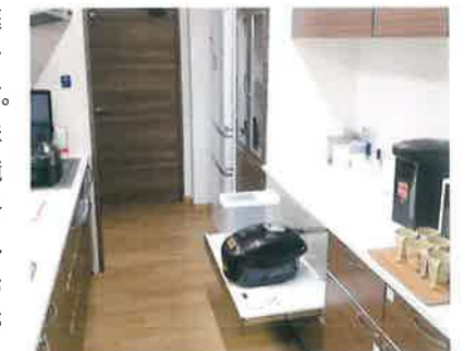
ユニットキッチン

入居者様が日常的な家庭の雰囲気の中で生活できるように心掛けています。ご飯が炊ける匂いやお味噌汁の香りが広がる環境を大切にしています。入居者様と職員と一緒に楽しみながら食事の準備やお菓子作りに携わることができます。