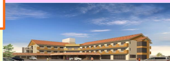
サービス付高齢者向け住宅「エルム撫川 かりん棟」