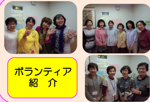
ボランティア紹介