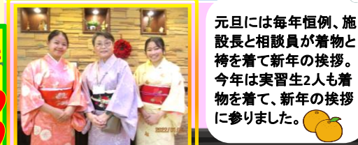
元旦には毎年恒例、施設長と相談員が着物と袴を着て新年の挨拶。今年は実習生2人も着物を着て、新年の挨拶に参りました。