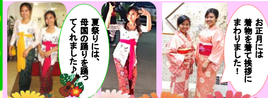
お正月には着物を着て挨拶にまわりました！ 夏祭りには、母国の踊りを踊ってくれました！