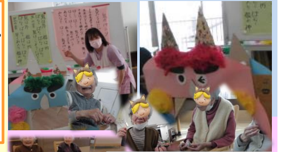
「節分」は愛らしい鬼に向かって「福は内」。豆の代わりに甘納豆をいただき「昔は歳の数だけ食べました。今、何個食べたかな?」「春が来ますよ」

層の上では啓蟄を過ぎ、虫や草花の様子にも春の風情が感じられることとなりました。3回目のコロナワクチン接種も終わりに安心しております。ふたたび面会の緩和ができ、お花見など楽しくお出かけが出来るようになればと願っています。🌸🌸🌸