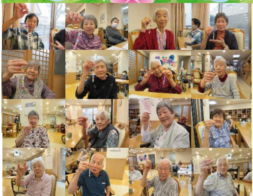
6/22~28 キーホルダー作り 本館

介護付有料老人ホームでは月に一度の誕生日会を行っています。みんなで美味しくケーキをいただきます。