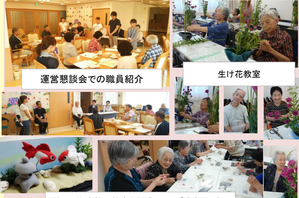
運営懇談会での職員紹介