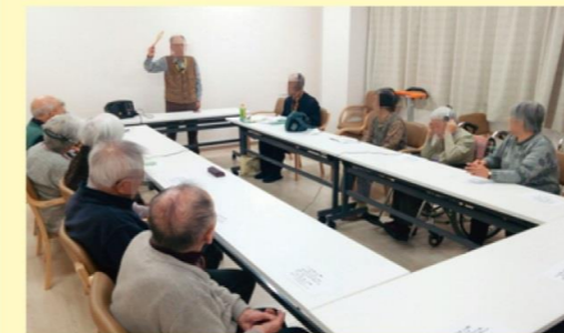
エルム寺子屋の様子

ご入居者主宰で、毎月開催している文芸講座「エルム寺子屋」。最近はお入居者がどんどん発表に参加してくださっています。5月の講座でもご入居者が発表してくださいませ。皆さまの主体的な参加をお待ちいたしております。