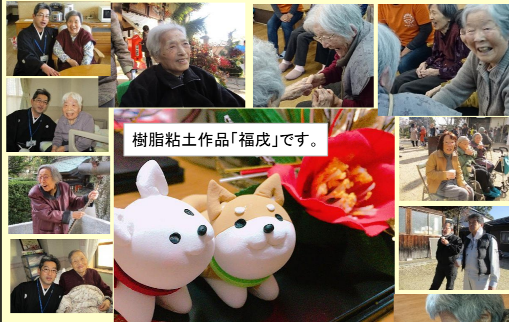
樹脂粘土作品「福成」です。